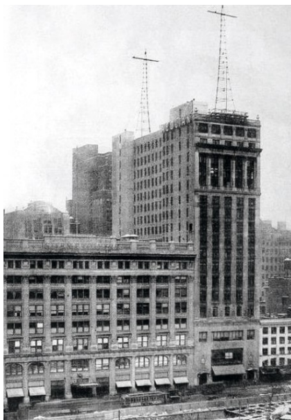
L'Aeolian Hall en 1923 à New-York

La foule est venue assister au concert « An experiment in Modern Music » proposé par le chef d'orchestre Paul Whiteman. Celui-ci souhaitait démontrer que le jazz pouvait s'intégrer à la musique de concert. Il commande alors à un jeune pianiste new-yorkais de 25 ans, George Gershwin, une œuvre mêlant les deux univers.